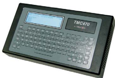
Компактный автономный контроллер TMC470